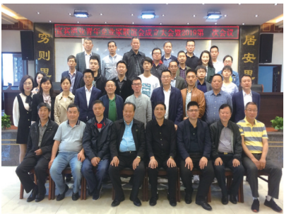
宜宾酒业青年企业家联谊会成立

一个人影响一个企业,一群人开创一个时代。4月12日,宜宾酒业青年企业家联谊会成立,标志着中国白酒之都、世界十大烈酒产区、中国浓香白酒核心产区——宜宾巩固提升核心竞争力,人才战略升级启动。