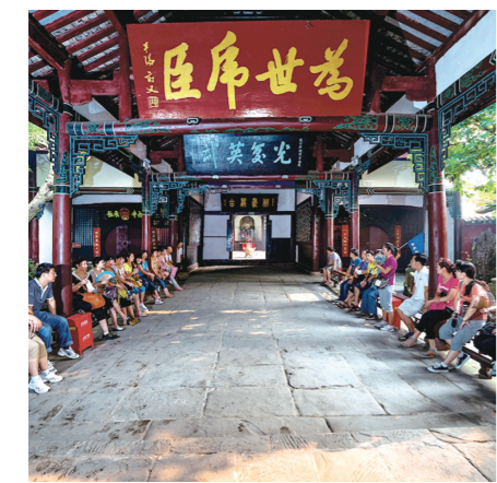
桓侯祠内歇息的游人

张飞在阆中百姓的心目中是他们公认的英雄,阆中乡贤在桓侯祠的匾额上称张飞“虎臣良牧”,是对张飞最高的礼赞。当然,张飞对阆中的影响是多方面的。他的忠勇激励着阆中人在工作生活上知难而进,遇到困难折不退。阆中人民也传承了张飞的侠义豪情,爱助人为乐,豪情仗义。特别是电视连续剧《三国演义》播放后,随着阆中古城旅游热潮的兴起,以张飞命名的旅游产品犹如一夜春笋冒了出来:张飞牛肉、张飞醋、张飞蛋丝被、张飞酒都为阆中人民创造了意想不到的价值;现在你走在阆中古城大街小巷中,总能听到《张飞英雄》的歌。在阆中人民心里张飞一方面是英雄的代名词,更重要的是,随着时代的变迁更迭,对张飞的仰视和怀念已经成为了老百姓对真善美的最后的坚持和守望。