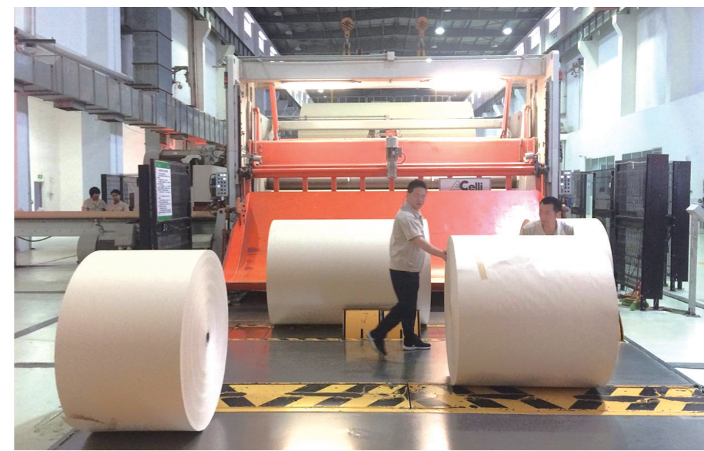
宜宾纸业食品包装原纸生产线