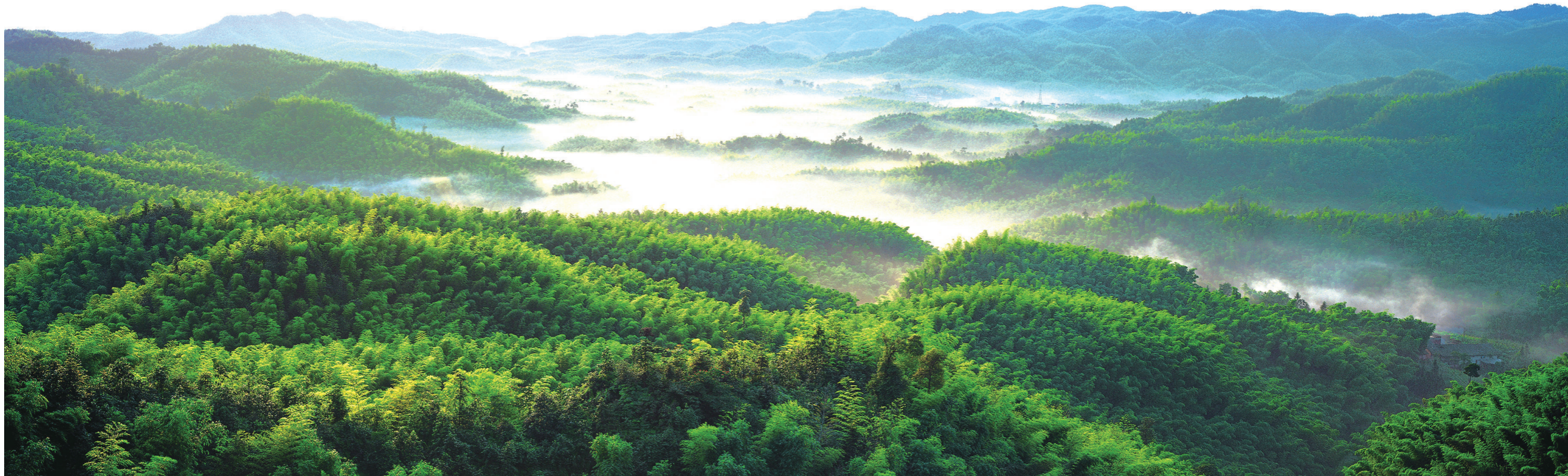
风景秀丽的蜀南竹海