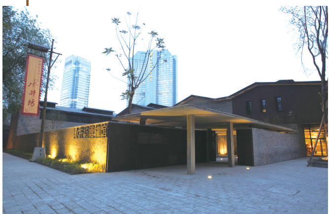
成都水井坊博物馆外观

一杯白酒,里面不仅装着百年历史,更是对工业遗产的保存和再利用,历史在这一刻焕发生机,重回人间。