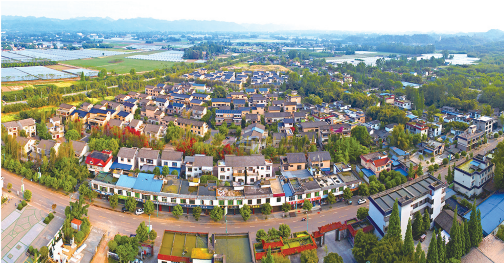
青神县著名的竹编村:兰沟村

作为国家级非物质文化遗产的青神竹编,这些年来传承和发展都进入了良性循环的轨道,进入产业化运作,成为地方经济的一大支柱。青神竹编具有规模大、艺术含量高、品种多、效益好的特点,在全国独占鳌头,畅销海内外。青神县也于1996年10月被国家命名为全国唯一的“中国竹编艺术之乡”。