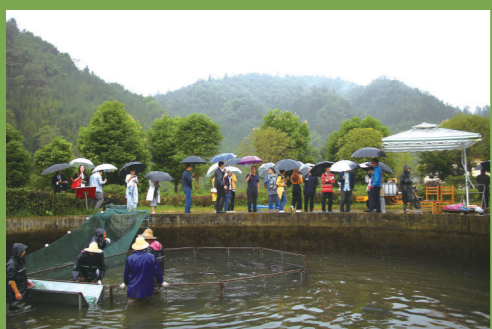
媒体代表参观四川润兆渔业有限公司