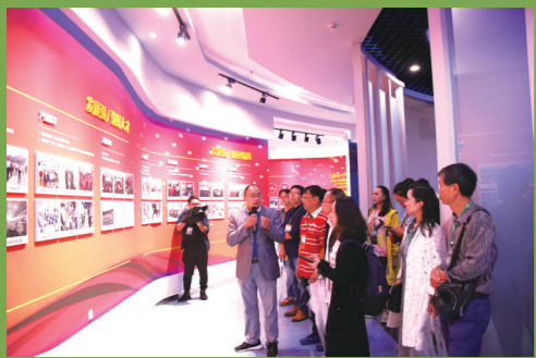
媒体代表观看芦山县产业集聚区综合服务中心规划