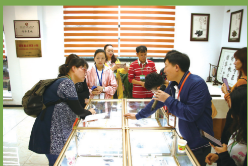
雅安迅康药业工作人员正在为媒体代表讲解

9月19日,参加“践行绿色发展理念 全国主流经济媒体四川行·雅安”活动的媒体代表一行走进了雅安迅康药业、芦山县产业集聚区湘邻纺织有限公司、芦山龙门镇、位于天全县的川藏物流(旅游)产业园建设现场、四川尔润玄武岩纤维科技有限公司、四川润兆渔业有限公司等,探寻雅安绿色发展新路径。