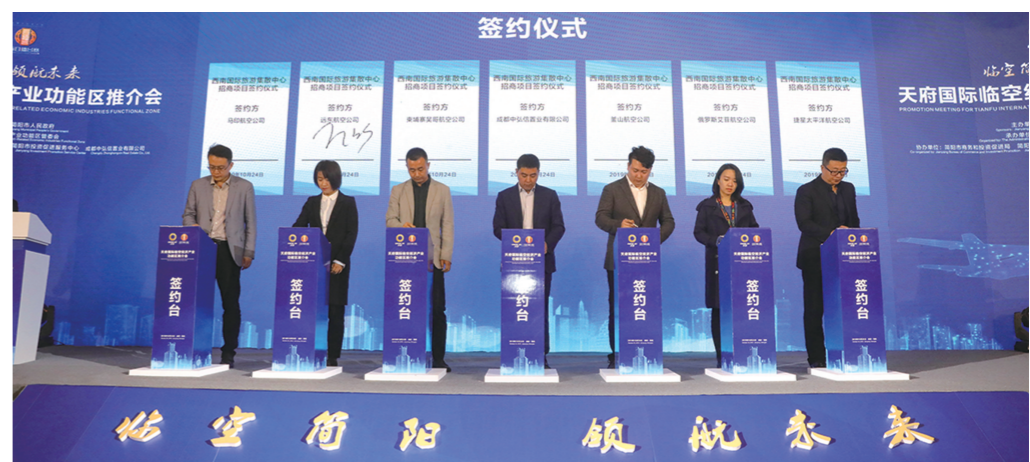
天府国际临空产业功能区推介会项目签约

在功能设置上，“一个产业功能区就是若干新型城市社区”。如位于产业建设起步区的简阳北新型城市社区项目。其定位为新零售和商品贸易，以供应链运营中心、创客中心、现代服务业为支撑；以金融产业、电商运营关键技术研发、科技创新为引领，打造聚集跨境电商、互融创新、总部经济等多元化于一体的产业新城和15分钟“一站式”生活服务圈。