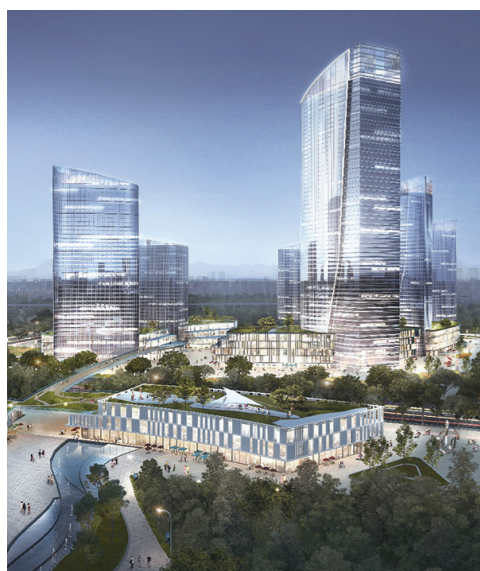
天府国际临空产业功能区效果图