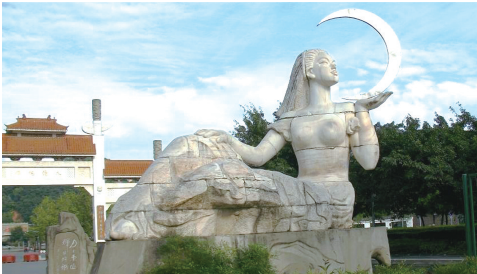
叶毓山创作的雕塑作品《月上东山》