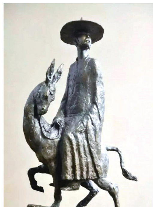
叶毓山雕塑作品《陆游》