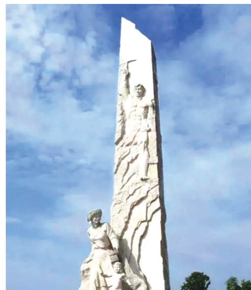
叶毓山创作的川北抗震主题纪念碑《新生》