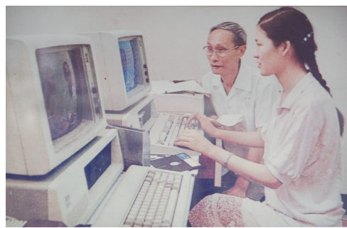
1986年，五粮液计算机勾兑专家系统

从“江之头”宜宾走来的“酒之头”五粮液，在新中国辉煌70年时光里，采天地之灵气，承文化之精粹，集五粮之精华，以持之以恒的工匠精神，向世人酿造出了一杯“大国浓香”。