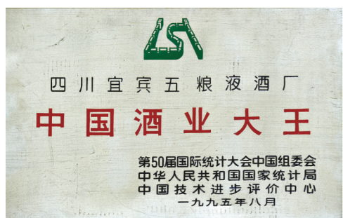
1995年，五粮液被授予“中国酒业大王”称号