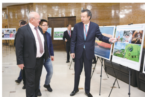
五粮液不断扩大全球“朋友圈”