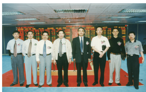
1998年，五粮液股份公司在深交所挂牌上市