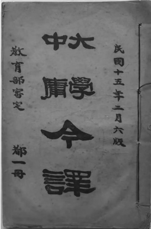
1926年2月,张佩严撰《大学中庸今译》第六版