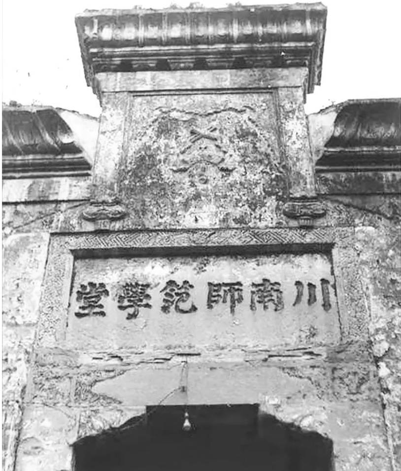
1902年,川南师范学堂正门