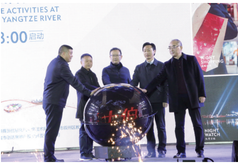
“宜宾南·叙州夜”长江首城夜生活体验行启动

宜宾市是四川省向南开放的桥头堡和门户，是成渝城市圈经济交流支点，叙州区作为宜宾市主城区，积极响应宜宾市委、市政府大力发展夜间经济的总体部署，倾力打造“宜宾南·叙州夜”城市品牌，推出唐人财富中心、市政广场体育中心、城北新区文体中心、三江口CBD商务中心和高铁中心五大夜间经济中心，提档升级“五大商圈”，为宜宾加快建成全省经济副中心贡献叙州力量。