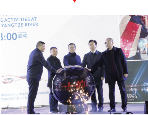
“宜宾南·叙州夜”长江首城夜生活体验行启动