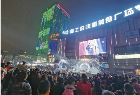
“宜宾南·叙州夜”长江首城夜生活体验行活动现场

2019年12月31日晚，万里长江第一城灯光璀璨，在美妙的音乐声中，“宜宾南·叙州夜”长江首城夜生活体验行暨叙州区迎新年荧光夜跑活动启动。