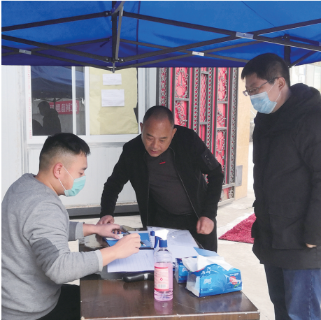
永兴街道现场指导布洛森家居做好防疫工作

多措并举稳生产稳增长 永兴街道 自战“疫”以来,永兴街道在万众一心、多措并举抓复工复产的同时,将稳生产、稳增长作为重中之重,抓春耕生产,促企业发展,带动区域经济发展全面开花。 记者获悉,在抓好疫情防控和复工复产工作中,街道先后制定《永兴街道企业节后复工复产疫情防控工作方案》《永兴街道个体工商户节后复业疫情防控工作方案》以及复工复产工作流程图。并成立了8个工作组,组织40余名驻企专员,包片联系企业和个体工商户798家(其中企业44家,个体工商户754家),指导企业抓实“四个一”防疫措施。即动态更新“一本”员工健康台账,常态设立“一个”体温检查点,灵活安排“一间”隔离室,每日完成“一次”全面消毒。 在此基础上,街道指定一名分管领导负责企业复工复产,并组织党员干部下沉一线,全面落实一家企业一名联络员、一个行业一个专班制度,一对一帮扶,全域开展“送政策、帮企业、送服务、解难题”暖心活动,充分调动各方面的积极性和创造性,助力企业稳产满产;统筹抓企业稳增长扶持政策落地落实,持续提升制度供给的速度、力度、精度。