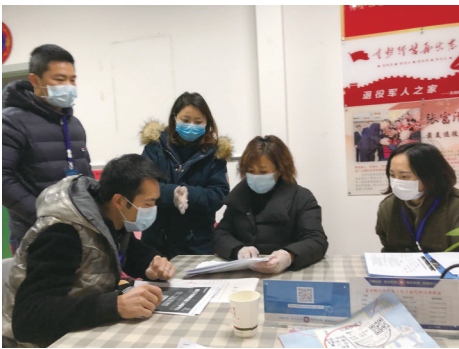
万安街道帮扶企业复工

多管齐下吹响复工复产“冲锋号” 万安街道 万安街道以防控为底线,安全生产工作为重点,主动作为,超前谋划,不断压紧压实各方责任,多管齐下帮扶227家企事业单位全面复工复产。 记者获悉,街道成立了复工复产工作领导小组,建立了街道联系领导+办公室+服务专员和联系领导+市场监管所+社区网格化的两套三级服务复工复产工作机制,通过“线上辅导+驻企指导”方式,帮扶企业和个体工商户认真落实防疫要求,切实履行企业和个体工商户防控工作主体责任。并坚持靠前服务,确保安全运行,目前已为复工复产企业和个体工商户提供口罩5000余个、消毒液1000余斤、体温枪20余把、防护服20余件。另外,还聘请了20余位医疗志愿者为个体工商户提供防疫指导。截至目前,提供中医咨询3000人次,发放预防中药药剂15000余副;统筹安排医护人员提供专业指导服务100余家,提供上门服务500余人次。 在此基础上,确保企业规范运行,科学防疫细化了健康状况证明服务办理流程,积极加强组织协调,解决办理健康证明遇到的各类问题,确保健康服务体检人员应办尽办、每日清零。目前,已登记办理健康证明1800余人。 截至目前,已出动1000余人次,巡查1300余家企业及商家店铺,指导复工复产450余家,及时整改问题20余个。