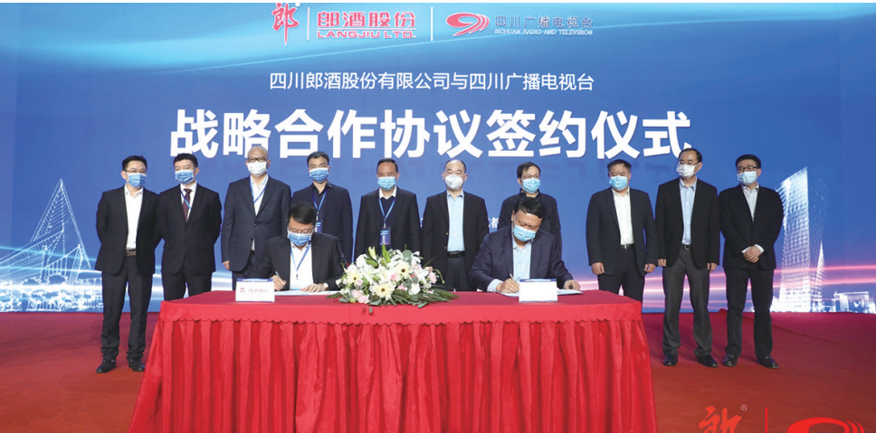
郎酒集团、四川广播电视台签订并互换战略合作协议

郎酒股份是以生产经营中国名酒“郎”牌系列酒为主营业务的大型现代化企业,现有15家全资及控股子公司,凭借得天独厚的自然地理环境和入选国家级非物质文化遗产的酿造技艺,练就了郎酒“生长养藏”的独门秘籍,成就了郎酒举世闻名的品质,郎酒股份旗下“青