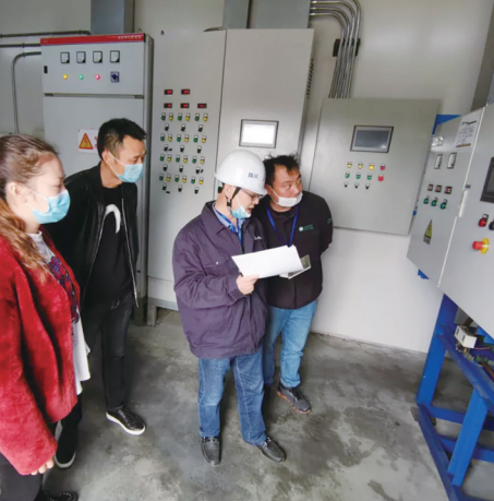
新兴街道检查特征设备保障企业安全生产

织密“三张网”助力复工复产 新兴街道 新兴街道坚持“双线作战”工作思路,一手抓疫情防控,一手抓经济发展。 织密“责任网”,制订《新兴街道关于节后返岗复工复产疫情防控工作实施方案》,以“网格化”管理为抓手,聚焦小桥庙山片区,细分15个网格,绘制房东院落树状图1500幅,形成“委—街—村”三级联动疫情防控格局。 织密“监控网”,重点聚焦“三个重点人群”,在街道市场、村(社区)、主要交通节点设立登记点43处,定制二维码建立返蓉人员信息网络登记平台,动态收集园区企业3969名员工返岗信息;以“定人+定点”形式,建立摸排台账5本,督促复工企业持续做好摸排登记、人员分类管理、体温检测、员工权益保障等工作。 织密“指导网”,通过线上沟通和现场督促等方式点对点、面对面引导复工企业落实主体责任,严守审批程序,有序复工复产。截至3月15日,95家园区外企业复工87家,复工率91.6%;49家(含物流企业4家)园区内100%复工;15家建筑工地、1998个商家正有序复工。