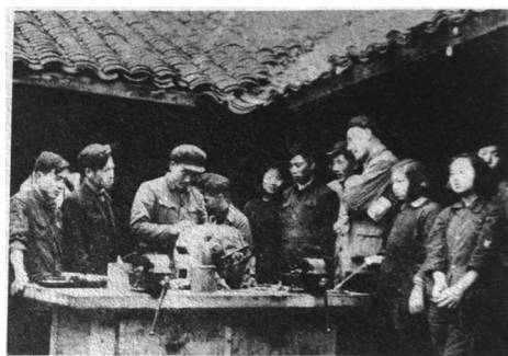
1958年研制的电机（资料图片）