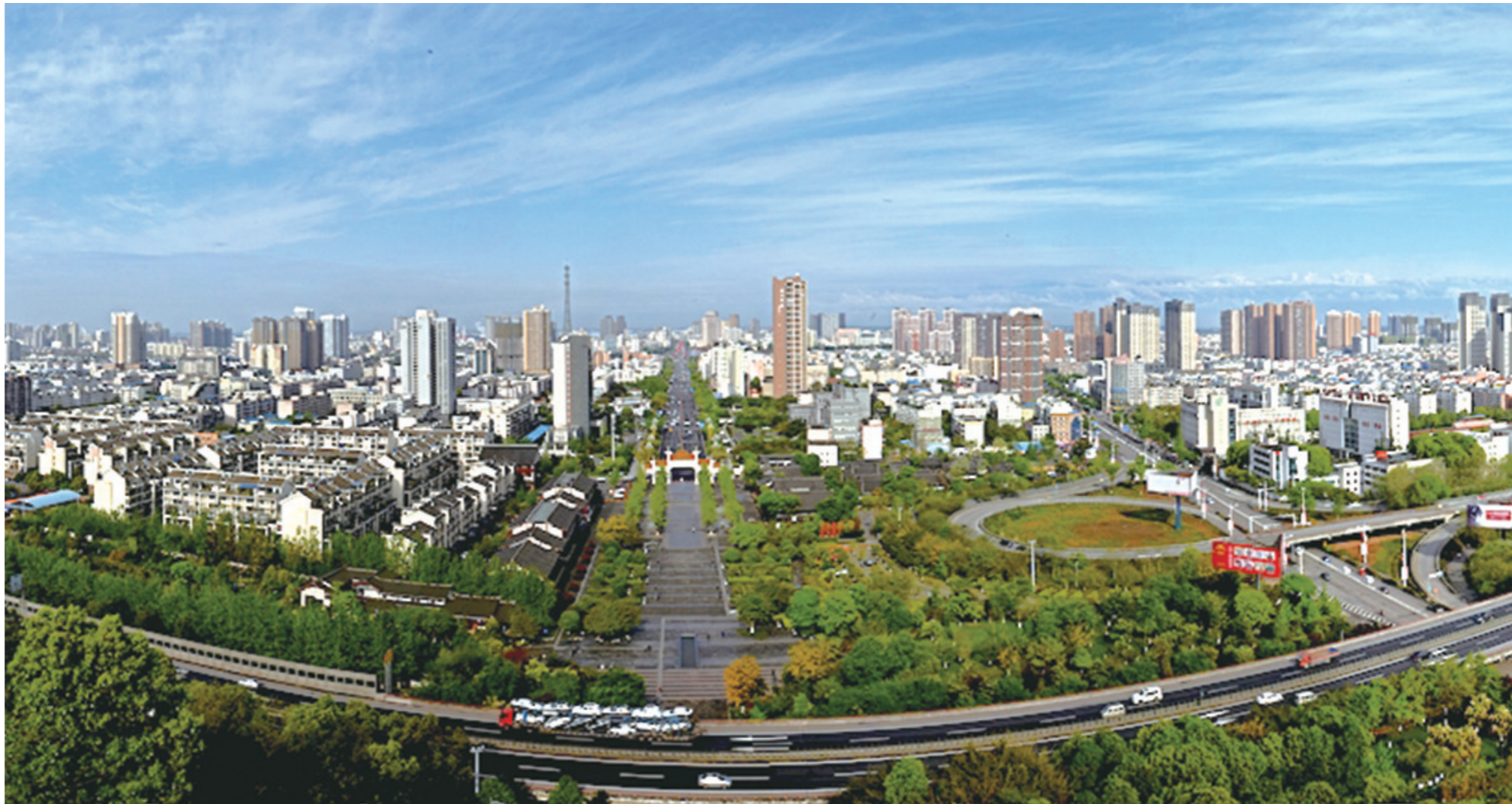
德阳新貌（唐泽全 轩视界）

在德阳旅行有人说是从一个工厂到另一个工厂。在这个随处可见机器、厂房的城市里游走，会有一种别样的感觉，无论是声势显赫的中国二重、东方电机、东方汽轮机，还是已经消逝或转型的耐火材料厂、东方电工厂（东工）等，都带着别的地方所没有的金属气息。德阳总会唤起人们对三线建设的美好记忆。