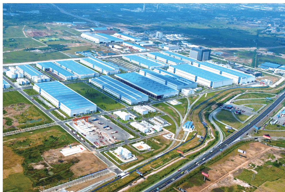
德阳东汽厂房全景（苏碧群 轩视界）

我一次又一次地为三线建设者们那些英勇豪迈所感动：与蛇共舞的什那钻采厂人，夜深人静打着手电筒拿着木棒在河滩野草丛中寻找的东汽人，在草棚里研制出电机的东电人，被拉丝车间银灰腐蚀了双手的川纤人及开着争气牌汽车在全国各地试车的大修厂人……让人难忘，一切如在眼前。无论后来怎样，1958到1978年的德阳二十年，当是德阳工业发展最美好的时光。曾经的记忆，铸就的辉煌，永不褪色。