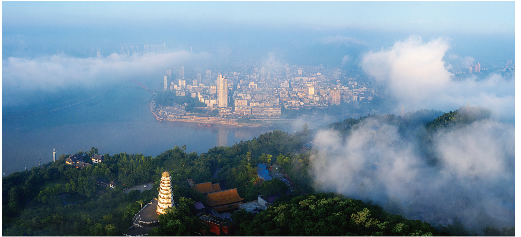
中国历史文化名城、哪吒文化之乡宜宾

宜宾渗透于民间信仰和民间习俗的哪吒文化，内容丰富、留下的遗址历史悠久，是我国哪吒文化保存最为完整，民众参与度最高的地方。2010年，宜宾哪吒传说作为民间文化入选宜宾市市级非物质文化遗产。2019年8月，宜宾市翠屏区被中国民间文艺家协会命名为“中国哪吒文化之乡”。