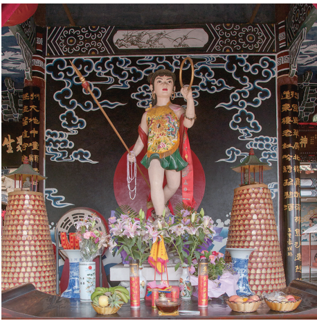
哪吒行宫内的哪吒塑像