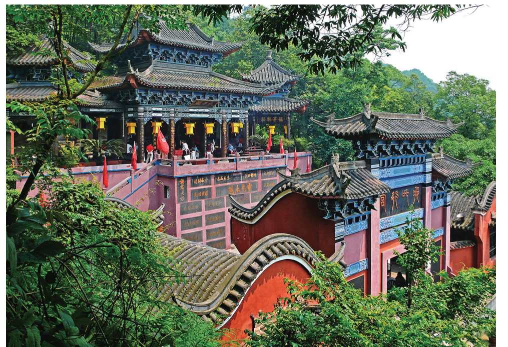
宜宾翠屏山哪吒行宫