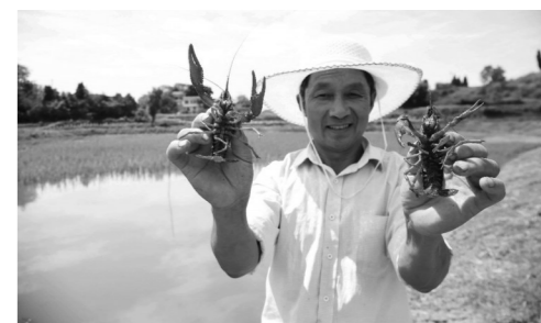
展示“水稻一小龙虾”

四川经济日报宜宾讯(叶昌荣 记者 杨波)“今年是我们的小龙虾第一年上市,预计销售收入将达100万元。”近日,在宜宾市翠屏区白花镇白安社区钼鑫水产专业合作社,一片片水稻青翠光亮,不少农户忙得不亦乐乎,田里传来哗啦啦的水声,一笼笼饱满硕大的龙虾被拉上来。该社区“水稻一小龙虾”共生生态种养模式示范田里的小龙虾因黄满肉肥、味道鲜美,受到市民热捧,稻虾共养的效益日益显现。