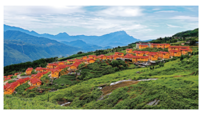
新林镇茗新村彝家新寨