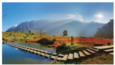
黑竹沟晨光