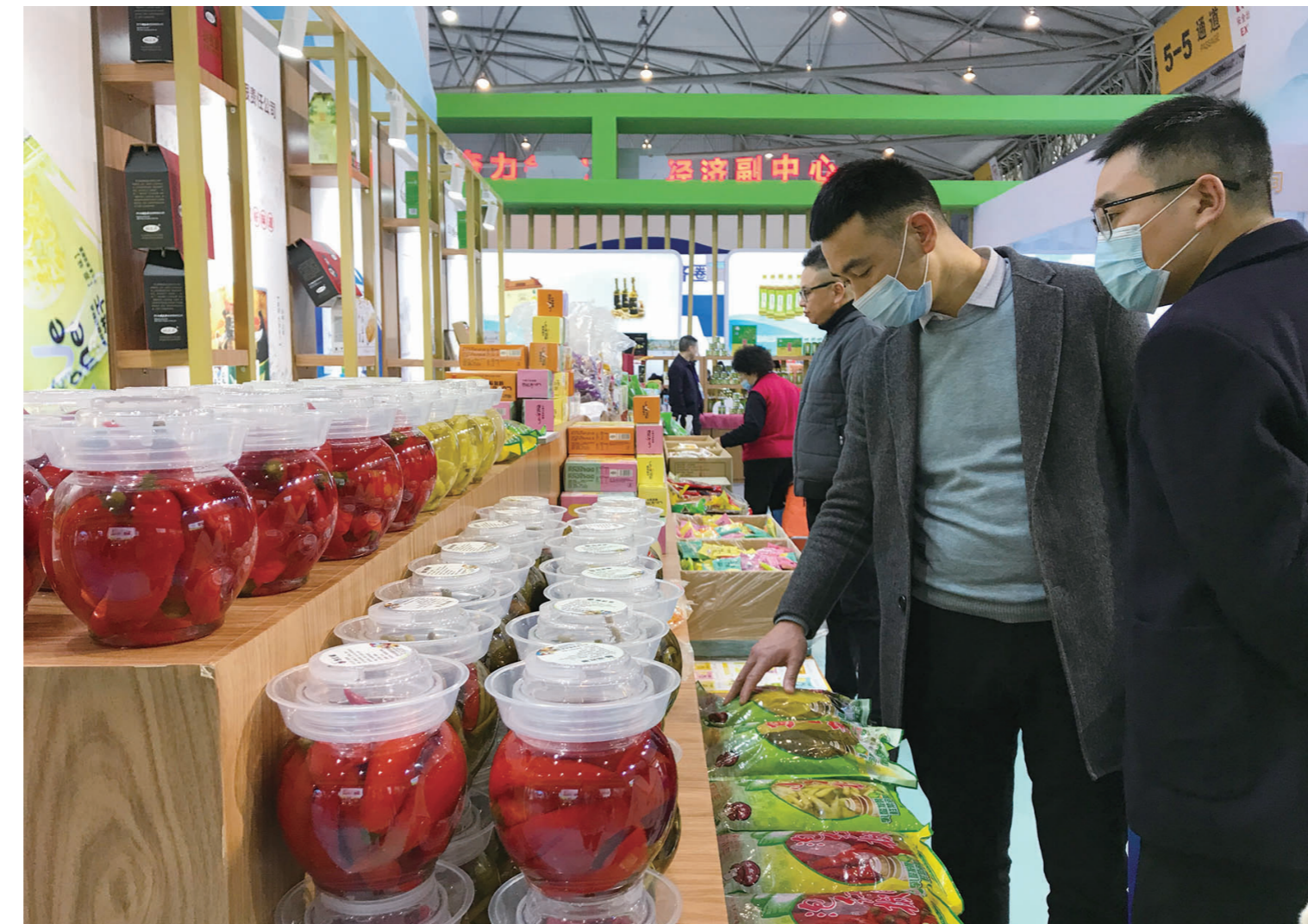
“四川造”泡椒吸睛球