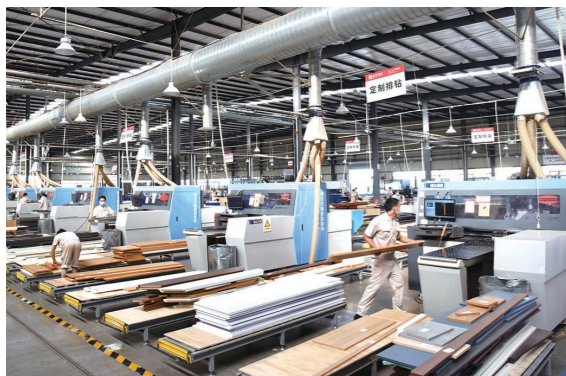
亚度家具智能生产车间