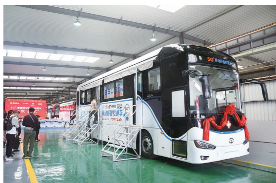
国内首批“5G+智能移动核酸检测车”下线

一个时代有一个时代的使命。而今,党的十九届五中全会和省委十一届八次全会作出的战略部署,为做好“十四五”以及更长时期工业和信息化工作提供了根本遵循。立足新发展阶段,贯彻新发展理念,融入新发展格局,四川工业和信息化战线将抢抓新机遇、迎接新挑战、勇担新使命、承接新任务,奋力开创制造业高质量发展新局面!