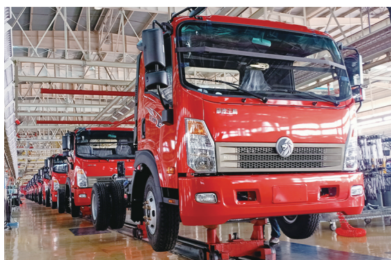
中国重汽集团成都王牌商用车有限公司的生产车间