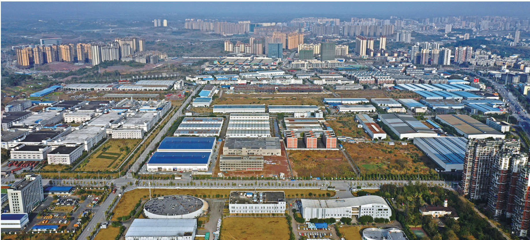
内江经开区全貌

如今,53平方公里的内江经开区托管区已跃然成为全市经济发展的主阵地、主引擎,一座西部地区极具活力和竞争力的国家级经济技术开发区巍然挺立于“成渝之心”。