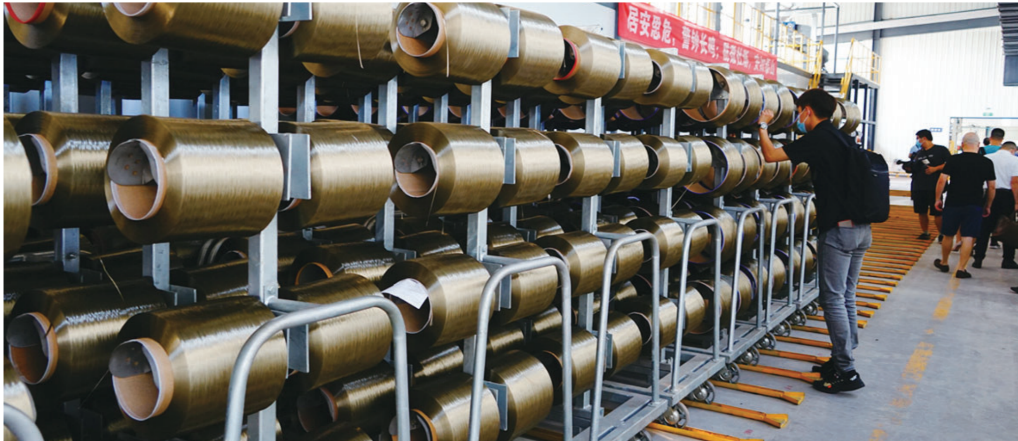
2020年8月31日,四川玻纤集团玄武岩纤维烘制生产线

如今,旌城大地,产业发展欣欣向荣,以工业为核心的现代产业体系构建取得突破性进展,高质量发展的基础支撑进一步夯实,为提振区域经济进一步增添了后劲。