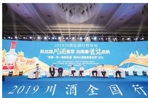
2019年8月9日,剑南春参加川酒全国行