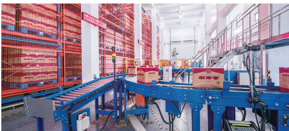
2020年,剑南春现代化立体仓库,既存放货物多,又是现代化管理

召开食品饮料产业推介会,举办第六届“中国雪茄之乡”全球推介之旅,与成都共同举办2020年成渝资现代农业园区联动发展峰会暨第六届中国(成德)智慧农业创新论坛,组织企业参加遇见巴蜀·国际融合采洽会、“川酒全国行”等各类展销活动,推选天府神龙等参与定