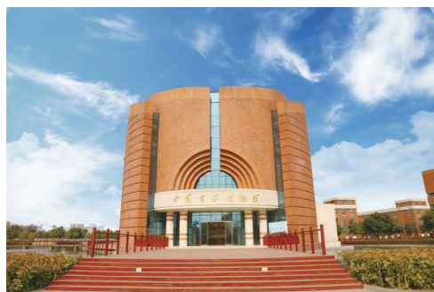
建成了中国唯一一家雪茄博物馆