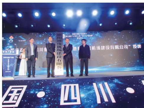
德阳通用机场建设有限公司授牌