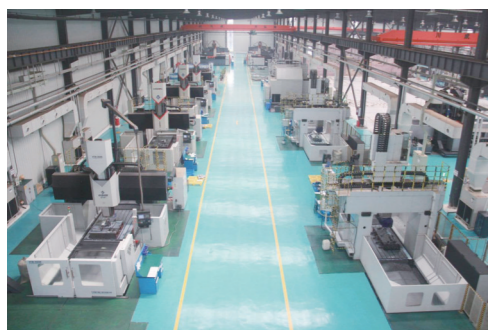
2015年,总投资5.6亿元的四川明日宇航工业有限责任公司数控中心项目顺利竣工投产