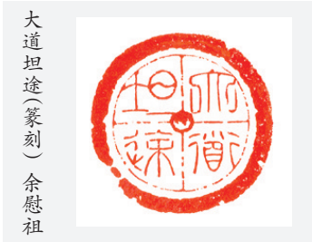
大道坦途(篆刻) 余慰祖