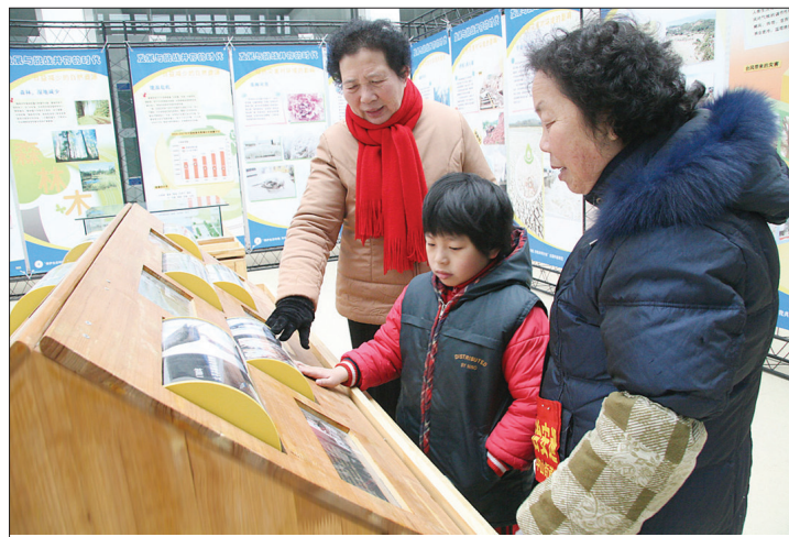
以“保护生态环境,你我共同行动”为主题的科普展览日前在松江科技馆举行。除了展版外,还有11件互动科普展品成了本次展览的亮点。这些互动科普展品通过声光电、模型、互动游戏等形式,形象、直观地介绍了生态环境知识。