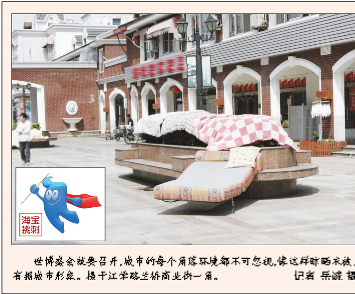
世博会就要召开,城市的每个角落环境都不可忽视,像这样晾晒棉被,有损城市形象。松江区学路兰桥商业街一角。 记者 岳晓 摄

清明小长假天气预报: 4月3日 阴转阵雨 8℃-15℃ 4月4日 阴转多云 9-15℃ 4月5日 多云转阴有雨 7-15℃