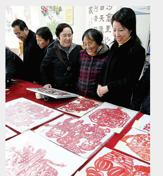
12月8日下午,方松老年协会江中分会举办了第二届书画工艺展示活动,此次展品包括剪纸、书法等。图为居民在欣赏剪纸。

记者了解到,我区消防部门对各单位的消防安全一直十分重视,对这些单位的安全主管也进行过专门的培训、考试,还经常分发消防安全知识的传单和光盘。可是从目前的情况看,部分经营业主的安全意识依然淡薄,对于消防安全存在侥幸心理,留下火灾隐患。消防部门表示,他们将建立长效机制,时刻提醒督促这些重点单位,使全区的消防安全意识和火灾防控能力保持在较高水平。