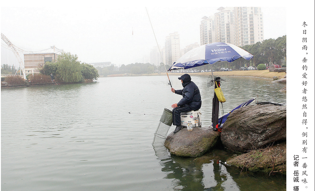
冬日阴雨,垂钓爱好者悠然自得,倒别有一番风味。

法院经审理认为,小于以非法占有为目的,采用持械威胁手段劫取他人财物,其行为已构成抢劫罪。但在庭审中,小于的父母提出,当年为了让他日后能早日出去打工,故在户籍登记时将其出生日期登记为1990年11月,而小于实际出生是在1992年。后经公诉机关确认,法院最终认定小于实施犯罪时未满18周岁,依法应当从轻处罚。日前,松江区法院作出判决,以抢劫罪判处小于有期徒刑4年6个月,并处罚金人民币5000元。