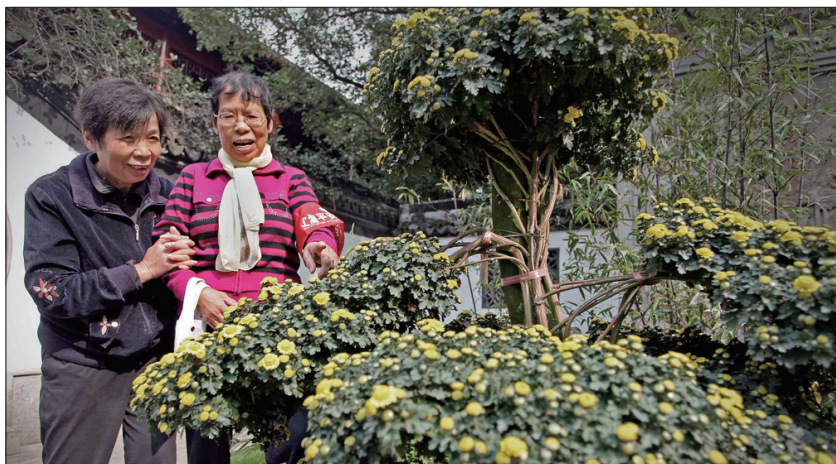
图为市民先睹菊花造型。

配上不同造型的菊花,每一处菊花造型都将与周边环境相协调。如内园河边设计的造型为悬崖菊,2米左右从上而下形成垂直立面,远看犹如山间瀑布;又如五色泉边设计的塔菊,自下往上仿佛平地竖起的一座高塔,蔚为壮观。而在内园各个厅堂里展出的都是经过人工悉心培育、具有一定规格的品种菊。为了方便游客,公园还在每个品种前放上介绍的标牌。