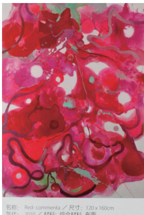
名称: Red commenta / 尺寸: 120 x 160cm 年代: 2010 / 材料: 综合材料 布面