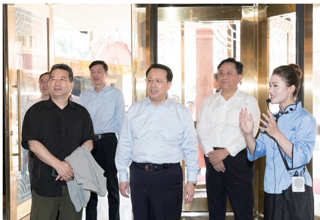
6月16日,市委副书记、市长龚正(中)在松江调研。