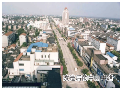
改造后的中山东路

1981-1983年，长1520米的中山东路路段进行拓宽改建，筑成宽36米的沥青路面。1999年，方塔路以东至东门段又经大修，路两侧建造房舍，开设店铺，商市日趋繁荣，形成一个商业小区。中山东路西端北侧有袜子弄，袜子弄临通波塘，接乐都路。2001年夏开始大修至年底完工，沿途植有粗壮的行道树，枝叶繁茂，浓阴蔽日。