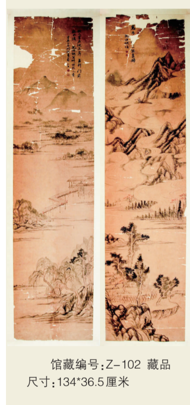
馆藏编号:Z-102 藏品尺寸:134*36.5厘米