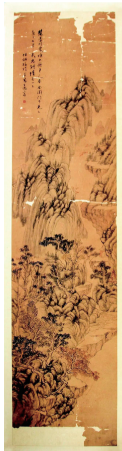
图2:馆藏编号:Z-105 藏品尺寸:134×36.5cm