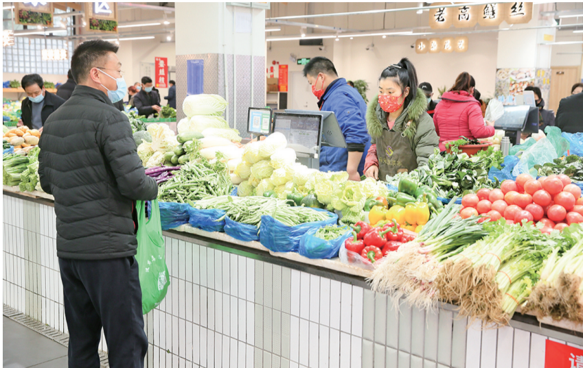
春节期间,农贸市场持续经营,保障假期市民基本购菜需求。