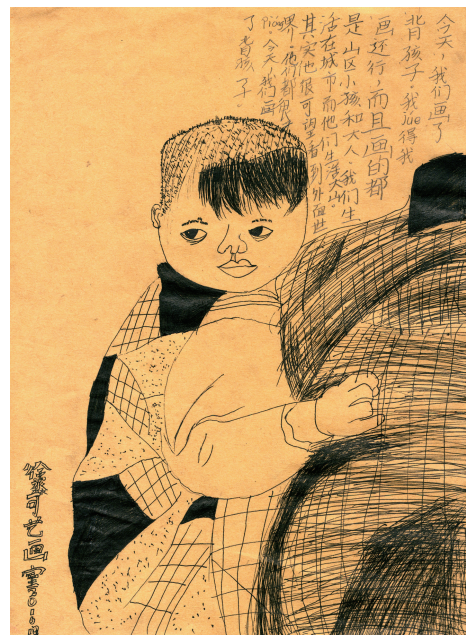
“我画这幅画的时候，小朋友们在生活白天的时候，用他们的眼睛看我们，我们也应该给他们画一些好看的东西。”