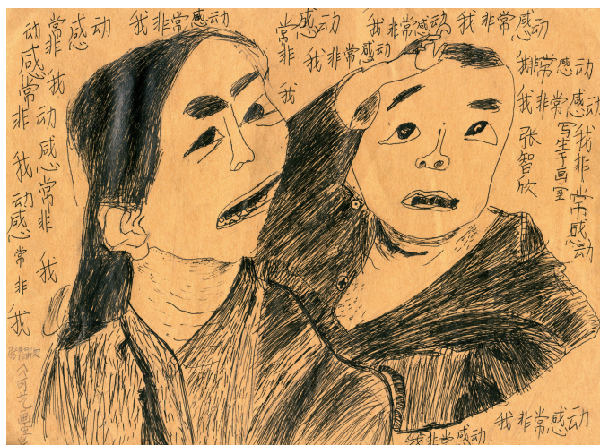
“我画这幅画的时候，小朋友们在生活白天的时候，用他们的眼睛看我们，我们也应该给他们画一些好看的东西。”