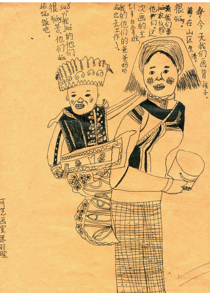
“我画这幅画的时候，小朋友们在生活白天的时候，用他们的眼睛看我们，我们也应该给他们画一些好看的东西。”