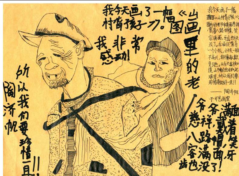
“我今天画了一幅《山村背孩子》。图画里的老爷爷满脸慈祥，戴着八路帽，笑容满面，牙齿也没了！后面还背着一个小孩，小孩一脸不高兴，好像有人欺负了他。从今天我才知道山村的生活如此艰苦，所以我们要珍惜一切！”

教师点评：二年级学员作品，细线条图画与粗线条文字形成对比，不但没有互抢主题，反而形成极具层次感整体构图，可谓抓人眼球的第一亮点。其次，画面安排疏密有致，衣服的花纹、人物的头发与五官的刻画，在细节处求精，在留白处大胆空白，简约而不简单。最后，线条简练，十分具有概括力，嘴角的法令纹、衣服的褶皱，线条多一分则显多余。画面中的文字由学员自行设计，俏皮可爱，生动有趣，足可见这是个多么活泼的孩子！