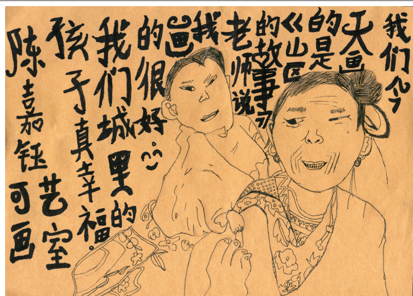
“我们今天画的是《山区的故事》，老师说我们画的很好，我们城里的孩子真幸福。”

一幅好的线描作品要从感情和技法两个方面来看，下面就跟着小编一起来欣赏可艺学员的优秀作品吧！