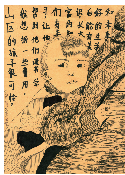
“山区的孩子很可怜，我想捐一些费用，帮助他们读书学习，让他们有丰富的知识，长大后能有美好的生活和未来。”

教师点评：一年级学员作品，画面自然轻松，灵动有趣，线条变化多端，充满着童趣，人物动态抓的特别准确：弯着的腰、前伸的脖子、张狂而又有序的头发，以及小朋友趴在背后的姿势，都做了夸张，特别有意思。