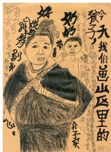
“我画这幅画的时候，小朋友们在生活白天的时候，用他们的眼睛看我们，我们也应该给他们画一些好看的东西。”