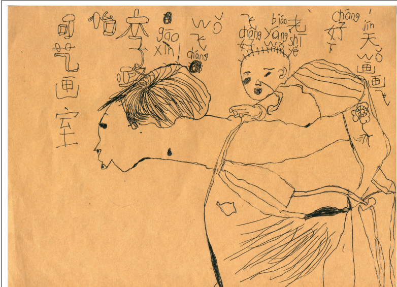
“今天我画画非常好，夏老师也表扬我非常好，我非常高兴！”

教师点评：三年级学员作品，画面里一大一小两个主题物（爷爷和孙儿）通过重色的肩带连接，造型功底可见一斑。此画最令人生趣的是图中人物的表情，爷爷的笑容和笑起来眼角的皱纹，孙儿挤在一处的眉头和紧紧抿着的嘴，仿若人在眼前正与你说话。孙儿的衣服用线条装饰，爷爷的衣服用点装饰，嗯，这是个对画画很有耐心的学员呢！