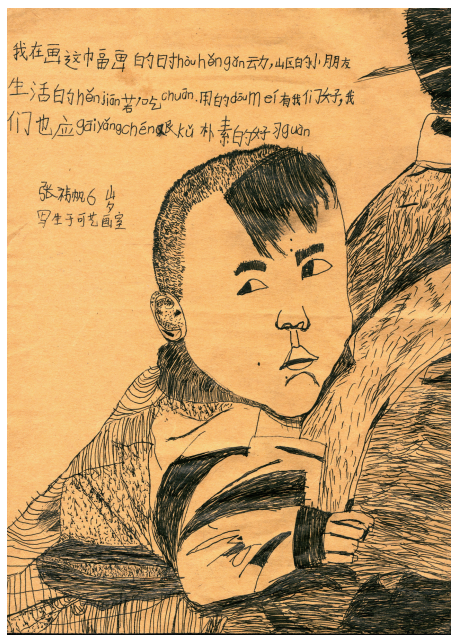
“我画这幅画的时候，小朋友们在生活白天的时候，用他们的眼睛看我们，我们也应该给他们画一些好看的东西。”