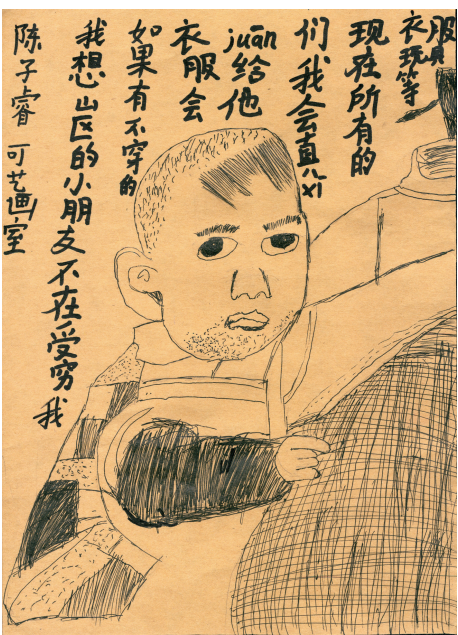
“我在这幅画里画了白天的时候，小朋友们在生活白天的时候，用他们的眼睛看我们，我们也应该给他们画一些好看的东西。”

在可艺，最有趣的不是孩子们充满创意的作品，更是对同一幅画不同的孩子有不同的解读，你会看到，可艺的孩子敢用自己的方式去表达自己。