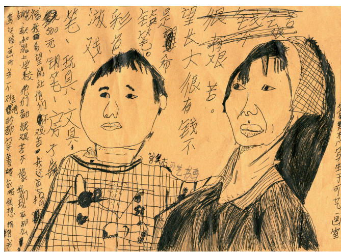
“我画这幅画的时候，小朋友们在生活白天的时候，用他们的眼睛看我们，我们也应该给他们画一些好看的东西。”