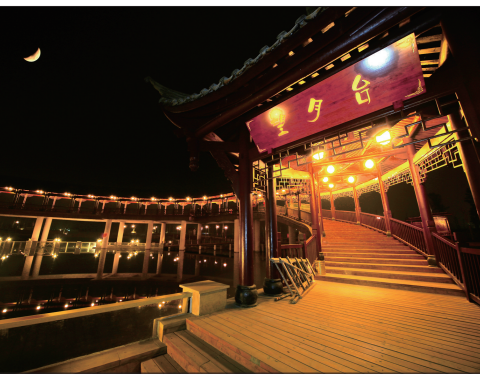
东坡城市湿地公园望月台夜景