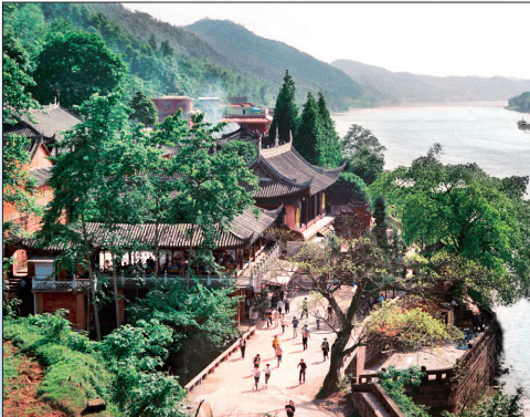
中岩胜景