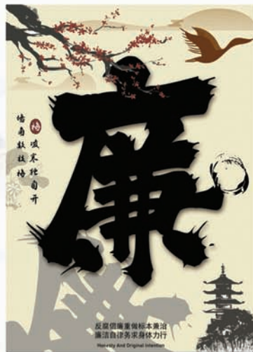
文化产业与旅游管理学院 徐梓姮 文化产业与旅游管理学院 郭夏伊