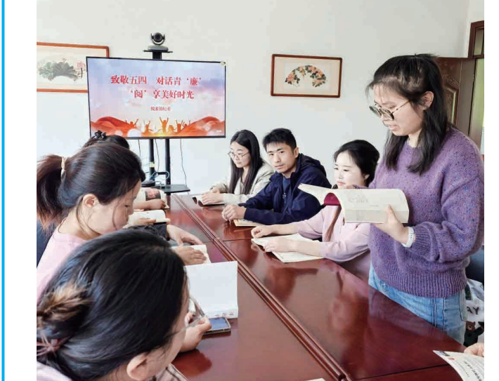
为引导青年干部扣好廉洁从政的“第一粒扣子”,近日,沭阳县悦来镇纪委组织开展廉洁从政主题读书活动,全镇15名青年干部齐聚一堂,以书为媒话清廉、以学促干强担当。