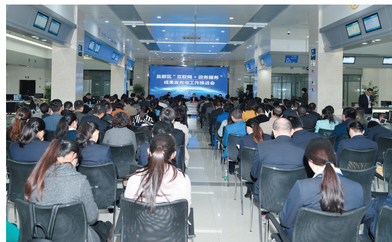
盐都区“互联网+政务服务”成果发布与工作推进会