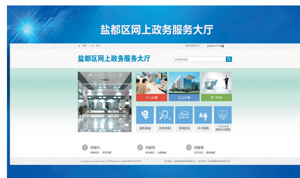
盐都区网上政务服务大厅首页截图