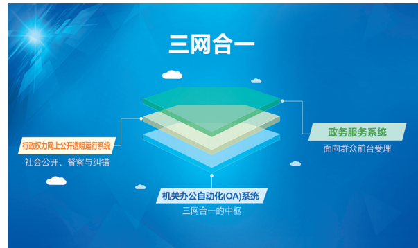
机关办公自动化+行政权力公开透明运行+政务服务三网合一示意图