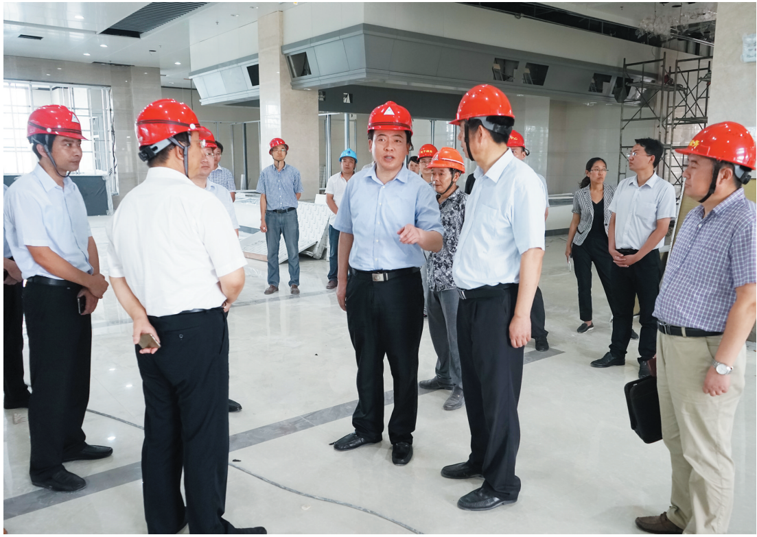
区委书记羊维达视察区政务服务中心建设现场

近年来,区委、区政府将“互联网+政务服务”提升到战略高度来重点重抓,区委书记羊维达在区第十四次党代会上明确要求:打通改革推进“最后一公里”,加快转变政府职能,优化行政审批流程,推行“互联网+政务服务”,以敬民之心,行简政之道,使政府更善治、市场更高效。围绕这个要求,在各部门的密切配合下,区电子政务管理办公室、区政务服务管理办公室、中国电信盐都分公司等相关单位通力协作,大胆探索,创新求变,初步建立起具有盐都特色的电子化政务服务体系,拓展了我区“互联网+政务服务”新型改革发展之路。