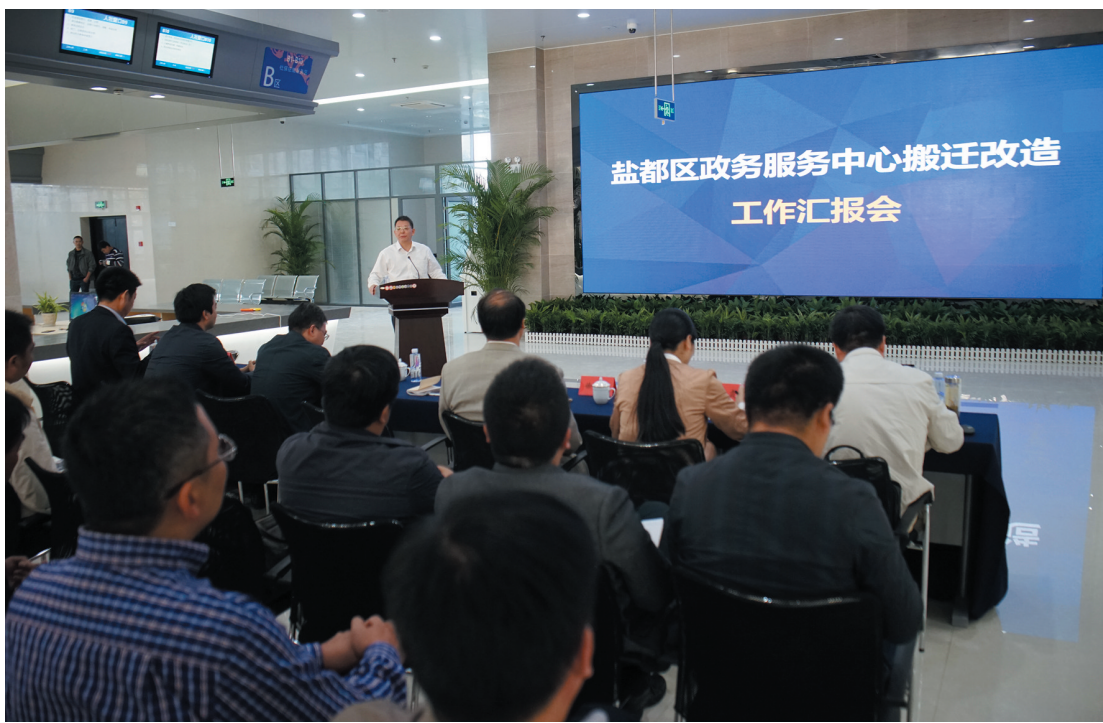
全区政务服务中心搬迁改造工作推进会