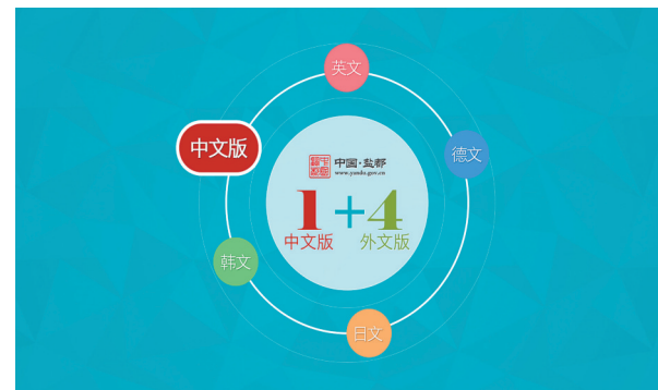
中国盐都网中、外文版本示意图