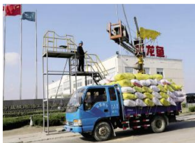
生产繁忙的益海粮油