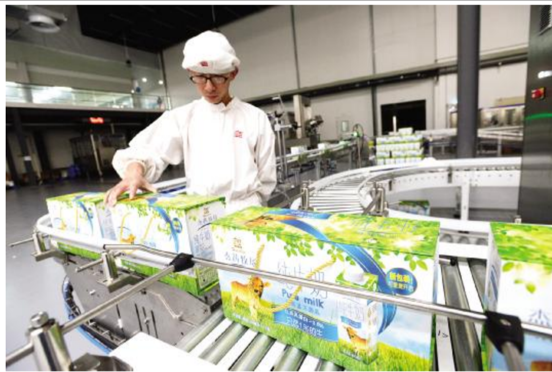
精工细作的辉山乳业

据悉,该镇立足深度设计,按照环境优美、特色鲜明、打造精品要求,高标准建设美丽乡村示范点,扮靓盐城都市后花园,先后聘请苏州熙城建筑规划设计咨询有限公司对镇内裕民、中华、盘西等三个农民集中居住点进行高层次设计,聘请盐城格致建筑规划设计咨询有限公司对其余36个居住点进行规划设计,一座座美丽整洁的村庄,从盘湾大地拔地而起。