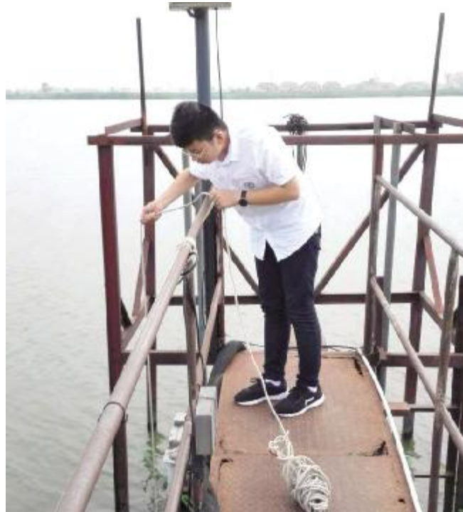
近年来,我县高度重视饮用水安全工作,坚持每日都对饮用水水源进行实时跟踪监测,确保人民群众喝上优质放心的饮用水。图为县环境监测站对射阳河饮用水源开展每日监测情景。

坚持执纪问责。在落实党风廉政建设主体责任过程中,始终挺纪在前,坚持防范与惩治相结合,既注重日常教育,又积极配合纪检监察机关查处违纪违法行为。局党委联合驻在纪检组,对“关键岗位”和“关键少数”挺纪在前,防止发生工作上的“微腐败”。今年以来,局党委深入落实“一岗双责”,先后对“管项目、管资金、管执法”的“三管”部门负责人开展廉政谈话 10 余人次,对苗头性问题及时提醒诫勉,确保“小权力”用得对,“小人物”管得住,及时打好“预防针”,增强“免疫力”。同时,对顶风违纪的党员干部依法依规追究相关责任,绝不姑息守土人。