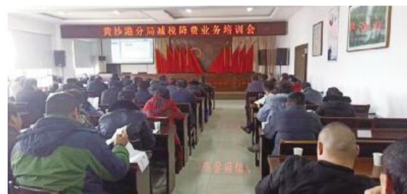
图为县税务局黄沙港分局开展减税降费政策培训。

该分局通过短信平台,将减税降费政策浓缩精华版发送到806户纳税服务对象手机上,并留下纳税人涉税诉求和意见快速响应的沟通