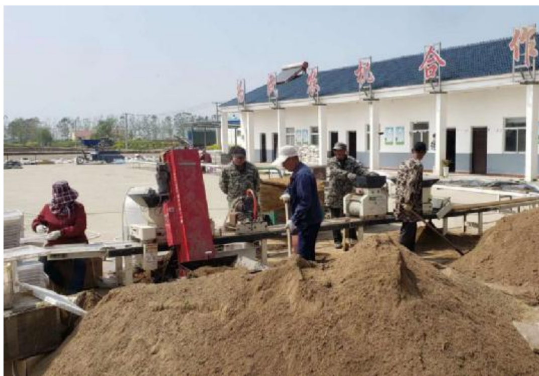
图为我县为农民专业合作社育秧流水线现场。

组织各育秧点迅速开展育秧工作。积极开展育秧准备宣传督促工作;组织工作人员走进田头督促机插秧面积、机具落实工作;有计划、有针对地开展机插秧实用技术培训。