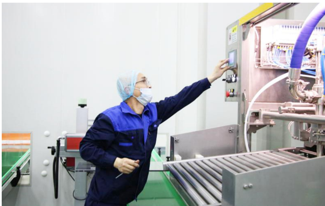
位于特庸镇的仁康蛋业有限公司是省内规模最大的集蛋鸡养殖、蛋品研发及液蛋生产销售于一体的现代化大型农牧食品加工企业，一季度生产液蛋产品超800吨，预计全年产量将突破5000吨。图为技术人员正在对设备进行定期保养。