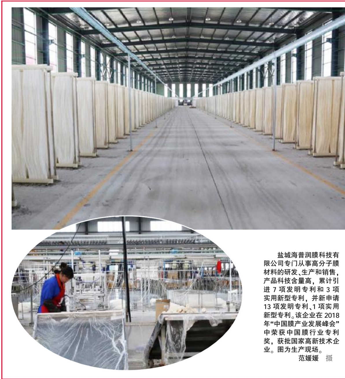
盐城海普润膜科技有限公司专门从事高分子膜材料的研发、生产和销售,产品科技含量高,累计引进7项发明专利和3项实用新型专利,并新申请13项发明专利、1项实用新型专利,该企业在2018年“中国膜产业发展峰会”中荣获中国膜行业专利奖,获批国家高新技术企业。图为生产现场。