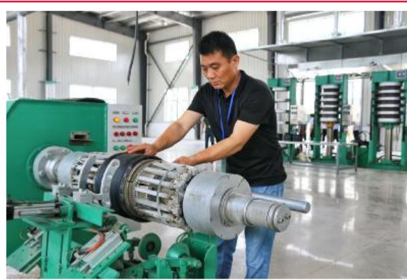
当前,洋马咬咬定全年各项经济指标不放松,严格按照“双过半”时间节点要求,以积极主动的工作态度,全力突破招商引资、载体建设、民生建设等各项重点工作,全镇上下掀起“大干二季度、冲刺双过半”热潮。

按照要求,4月初,县教育局对县内各考场进行室内改造,添置保密柜,整理强电与弱电线路,“四防、三铁、二器、一电话”全部到位。加强对县、校监控巡查系统和播音系统等设备的维护。5月中旬,会同电信部门对各考点考场的设施设备运行进行模拟演练,检查监听高考英语听力设备。召开考点考务会、生源学校送考负责人会、高考监考派出单位负责人会、考生诚信考试动员大会,签订诚信考试承诺书。严格选聘监考工作人员,从县城8所公办学校抽调290名教师及中层干部担任高考内外监考工作,从局机关抽调58名工作人员参加高考的巡视和服务保障工作,对监考、考务及巡视人员均采取培训、考核、持证上岗制度。高考前,县教育局联合相关成员单位成立试卷保密组、考点巡视组、视频监控组、后勤保障组,对接相关职能部门细化高考用车、食宿点审查过堂等工作,规范食宿点和考点周边的食品经营行为。对各考点附近的建筑工地进行噪音监测和检查,发布禁止噪音污染的相关公告,并加强考期督查。对接公安部门,在高考期间做好考生身份核查和身份证加急办理等服务保障工作,实施网络安全监控;对接交警、保密等部门做好试卷运送、保管等环节的安保工作,加大考点周边道路执勤岗的设置,在考场周边道路特别是易堵路段、路口增派民警,加强巡逻管控和指挥疏导,确保考试前后各考点门前及通往考点的道路畅通,努力做到考试组织工作零失误、考务工作零差错。