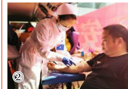
图2 市民积极参与献血活动