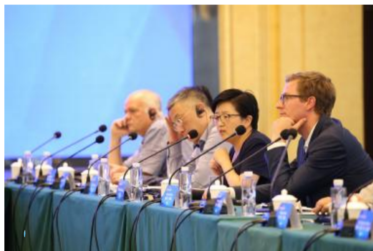
中丹(射阳)风电产业发展合作恳谈会上,互动交流环节。