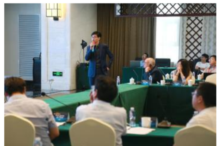
射阳国际海上风电产业新城和风电装备产业港规划咨询会上,射阳港口集团介绍风电装备产业港详细规划方案。