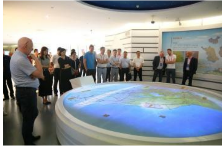
客商与专家参观县规划展示馆。

编者按:6月17日—19日,来自丹麦曲博伦港、格雷诺港以及远景能源、华能集团等一批海内外风电领域的专家和知名企业代表齐聚射阳,就射阳与丹麦风电产业深度合作进行对话,共同加快推进射阳国际风电产业新城和风电装备产业港建设。据了解,我县拥有105公里海岸线,拥有陆上集中式和分散式风电资源150万千瓦、海上南区风电资源170万千瓦、远海可开发风电资源1000万千瓦。目前,已成功落户世界风电装备行业前三强、国内最大海上风机制造企业远景能源、长风海工、中车时代新材等项目相继落地发展,一系列产业链项目成功签约,中广核、华能、大唐、国华等大型央企全面参与我县风电能源开发利用……一幅崭新的风电全产业链新图景正在鹤乡大地徐徐展开。本报现撷取中丹(射阳)风电产业发展研讨会活动的精彩瞬间,与广大读者一起分享。