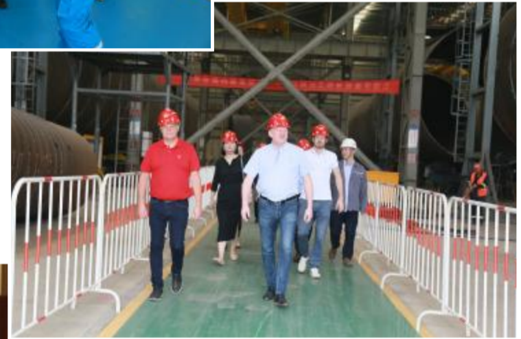
客商与专家参观长风海工。