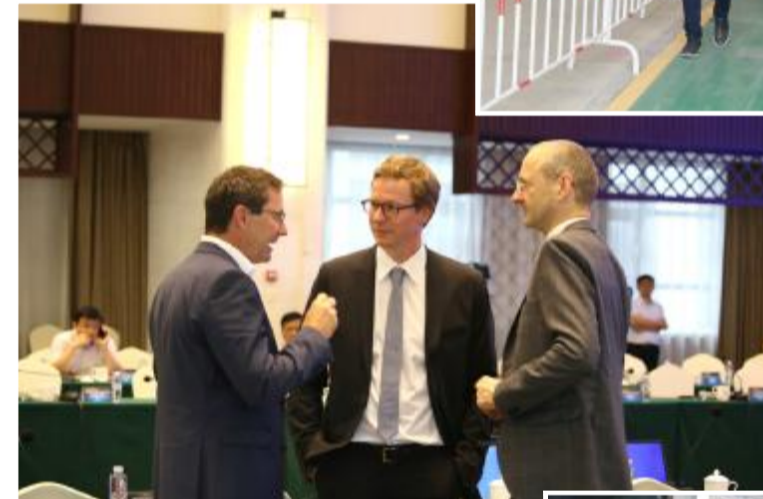
中丹(射阳)风电产业发展研讨会间隙,客商在进行热烈的讨论。