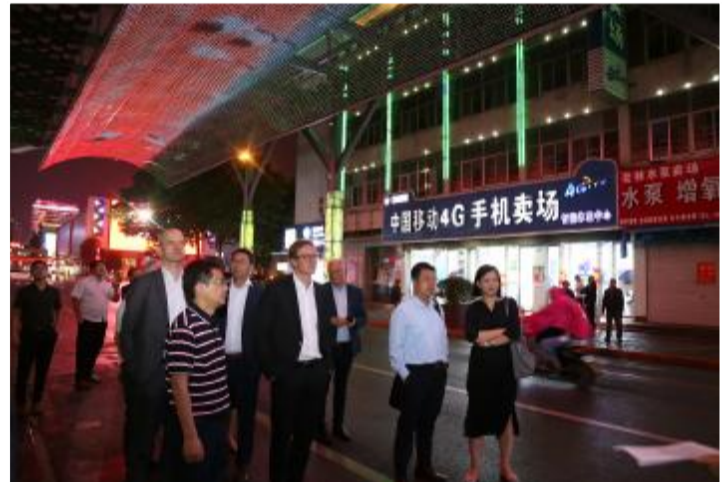
客商参观时光隧道夜景。