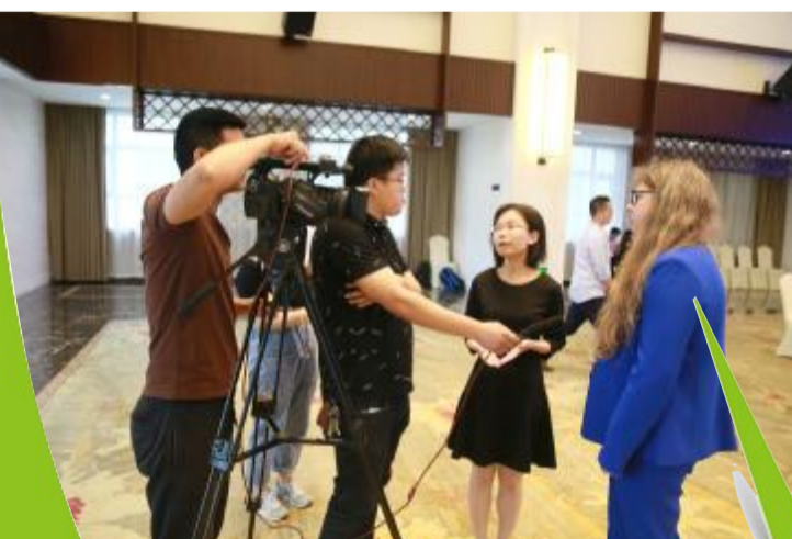
中丹(射阳)风电产业发展研讨会现场,媒体采访客商。