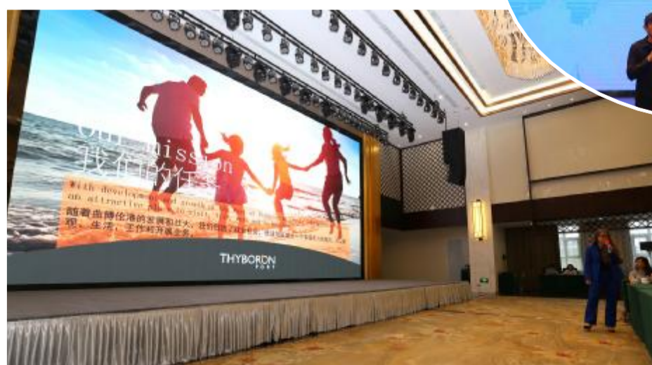
中丹(射阳)风电产业发展研讨会上,曲博伦港市场营销总裁蒂娜·詹森·勒·布雷顿作主旨演讲。