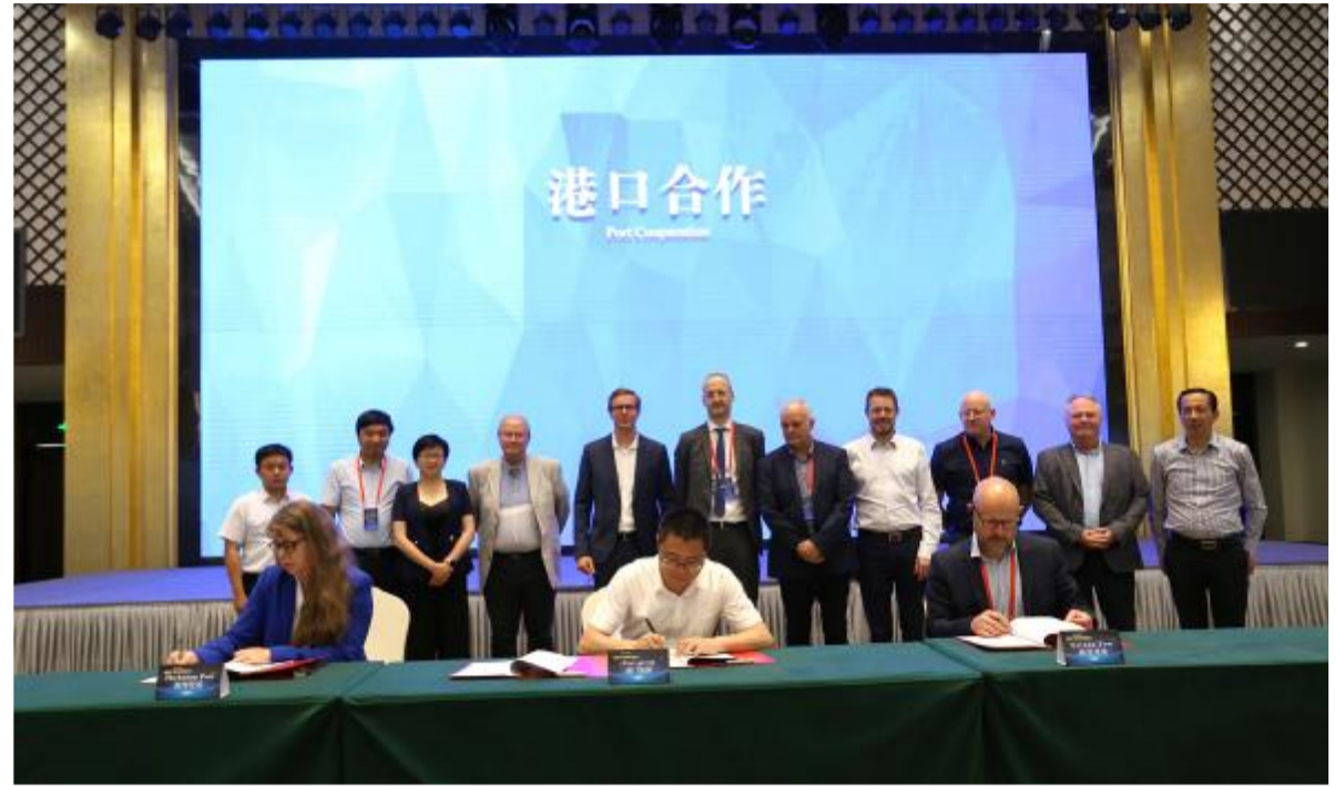
中丹(射阳)双方签订港口合作备忘录。