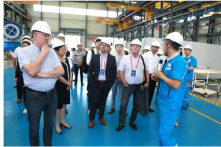
客商与专家参观远景能源。