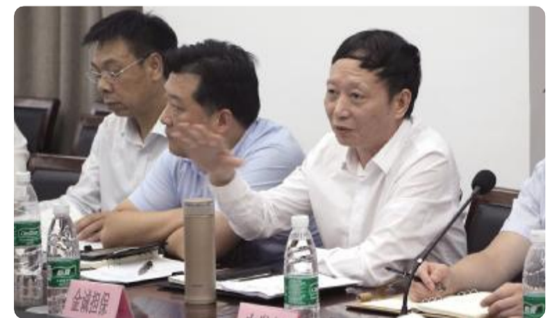
金融机构负责人介绍金融产品