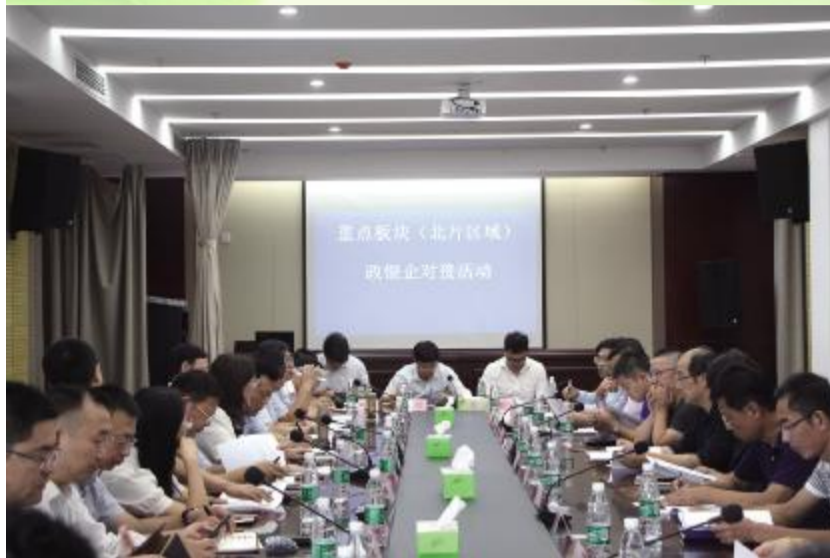
银企对接活动现场

编者按:为宣传推介镇区以实体经济为重点的经济社会发展情况,执排企业和项目融资需求,进一步实化银企对接、深化银企合作、强化金融支撑,9月24日,我县举行重点板块(北片区域)政银企对接活动暨三季度银行行长座谈会,来自县内12家金融机构和8家市级银行射阳区域负责人、金融担保公司主要负责人及10家有资金需求的企业负责人走近一线看生产、圆桌会议问需求,银企双方顺利对接,为企业发展注入源源不断的“金融活水”。