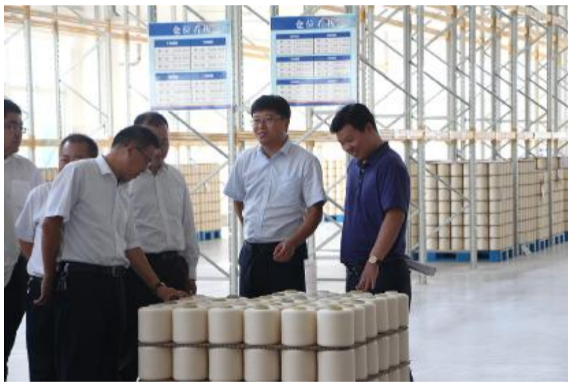
与会人员认真察看题桥纺织产品