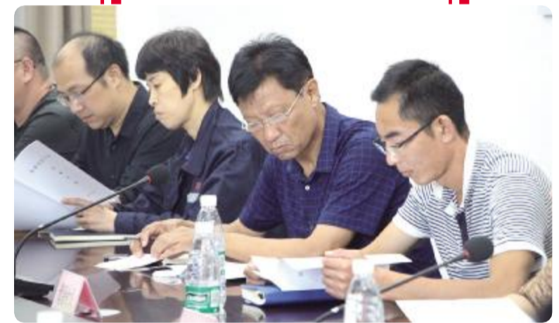
银企双方认真阅读相关资料