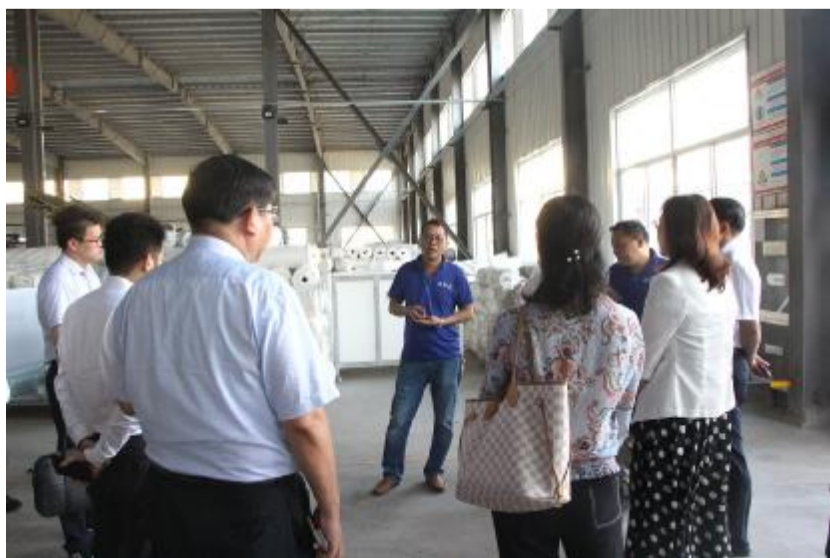
欧斯曼负责人介绍企业运行状况