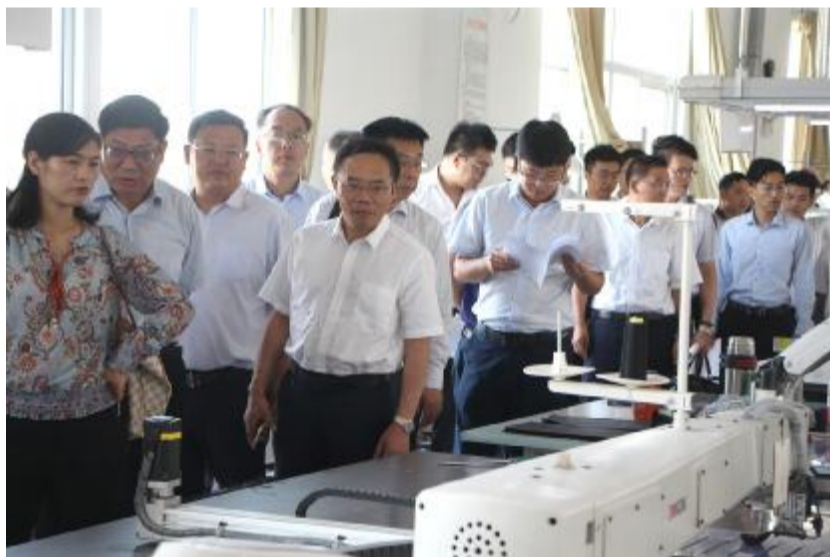
与会人员参观嘉荣纺织

存贷比。 截至8月末,余额存贷比70.48%,新增存贷比66.59%。在余额存贷比方面,农发行、中行、华夏银行、常熟农商行、太商村镇银行均超过100%;工行、建行、江苏银行、南京银行和射阳农商行保持在70%左右。在新增存贷比方面,中行、常熟农商行扩增信贷投放,保持贷款较年初呈增长趋势;农行、江苏银行和南京银行贷款新增存贷比为30%左右。