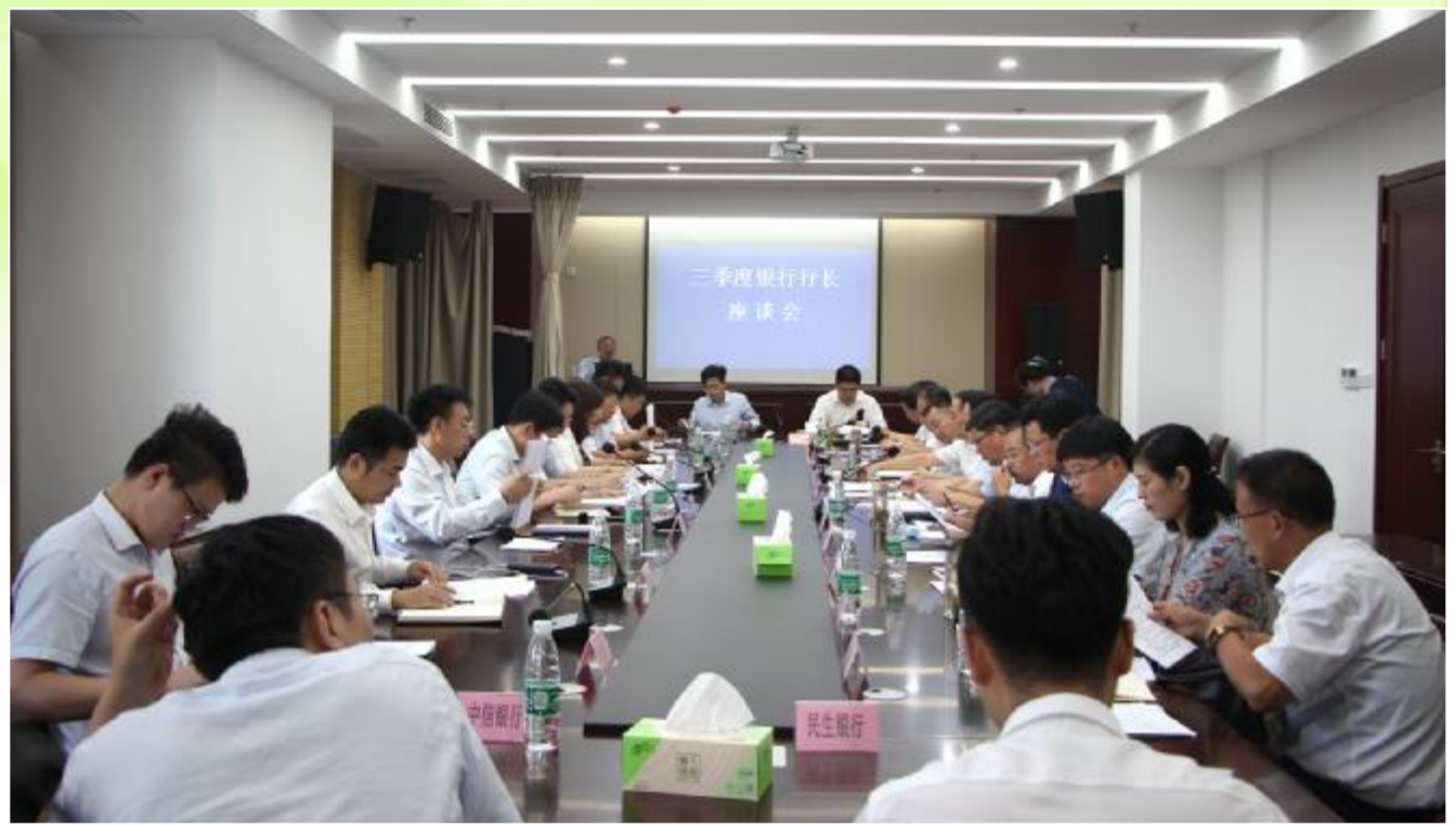
银行行长为金融工作出谋划策