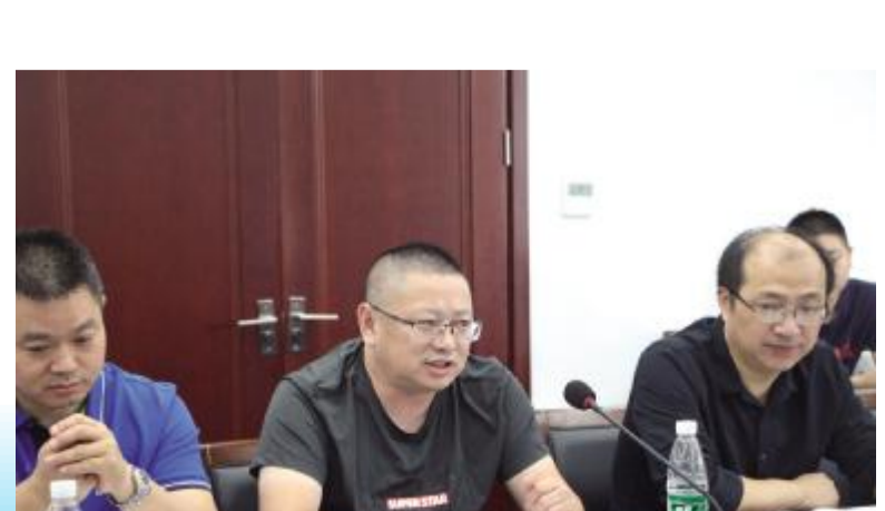
企业家提出贷款需求