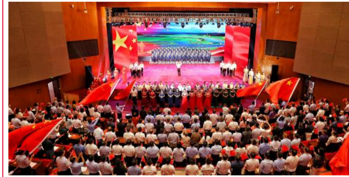
全场大合唱《歌唱祖国》将汇演推向高潮