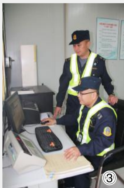
图③开展路警联合执法

连日来,县交通运输局按照上级要求,加大道路运输安全监管力度,狠抓运输车辆超载行为,从源头上杜绝超限超载的违法行为,强化“两客一危”道路运输安全管理,切实保障人民群众生命和财产安全。