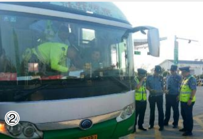
图②检查客运车辆载客人数