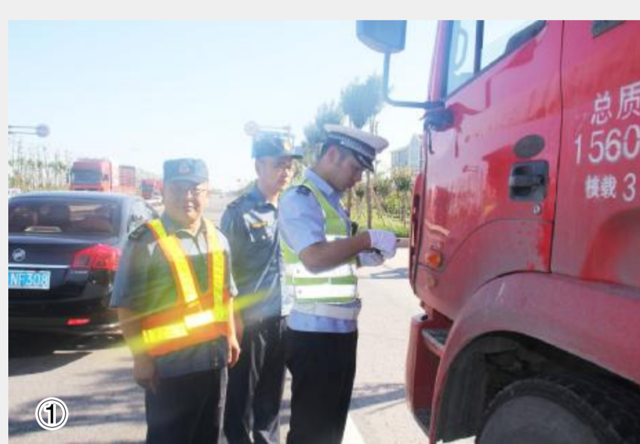
图①检测货车装载重量

该局通过一系列行之有效的大排查,对查出来的问题限期整改,并组织“回头看”,达到作风建设明显上升的效果,有力地推动了全系统工作提质、服务提效、形象提升。