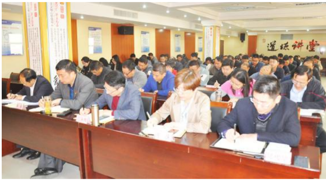
在“不忘初心、牢记使命”主题教育中,县水利局党委通过集中辅导与个人自学有机结合,着力提升系统党员干部政治站位,坚定水利服务保障全县经济社会健康持续发展的理想信念。图为机关党员干部及所属各单位负责人在集中听取辅导报告。