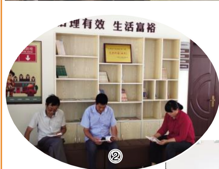
为充分满足城乡居民阅读需求,近年来,我县持续开展全民阅读活动,进一步倡导全民阅读的社会风尚,全力助推“书香射阳”建设。