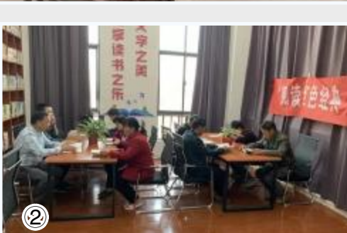
① 盘湾镇开展“以理论滋养初心，以理论引领使命”读书活动。 ② 特庸镇王村开展“阅读红色经典，传承铁军精神”经典诵读会。 ③ 射阳农商银行举行“书香射阳大讲堂”公益讲座。

年初以来，我县采取开展志愿服务、打造阅读品牌、强化阵地建设等措施，大力推进“书香射阳”建设，在全县营造爱读书、善读书、读好书的浓厚阅读氛围。